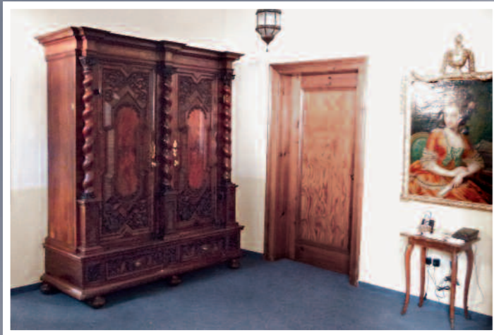
Augsburger Barockschrank mit höfischem Portrait

Sie finden den gesamten Katalog mit Abbildungen ab 14. November auf unserer Internetseite unter