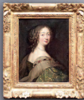
Frankreich, 18. Jh.