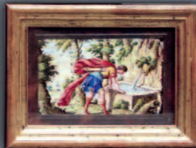
Frankreich, 16./17. Jhdt., Emailarbeiten