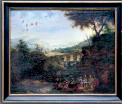
Italien, 17. Jhdt.