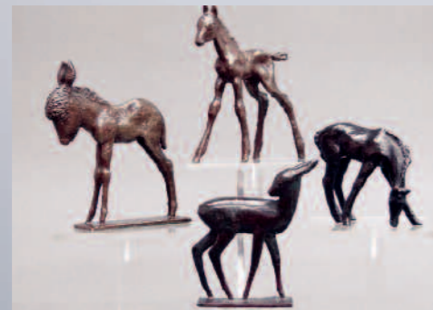
4 Bronzen, Renee Sintenis