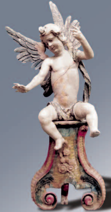
Sitzender Engel, 17. Jhdt.