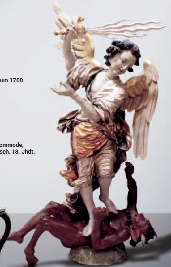
Hl. Michael, 18. Jhdt.