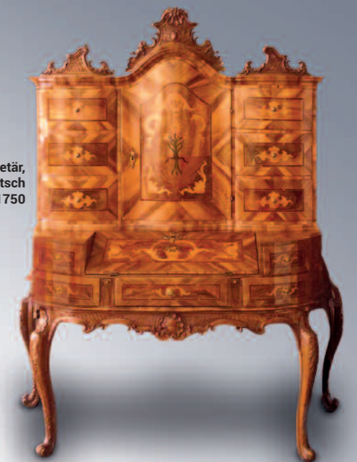
Tabernakelsekretär, Süddeutsch um 1750