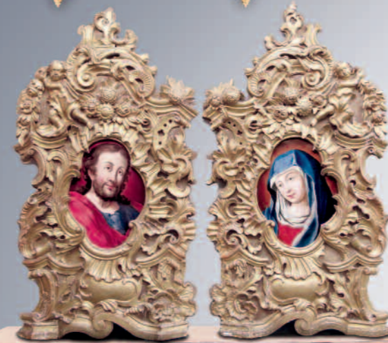
Paar Altarrahmen, um 1700