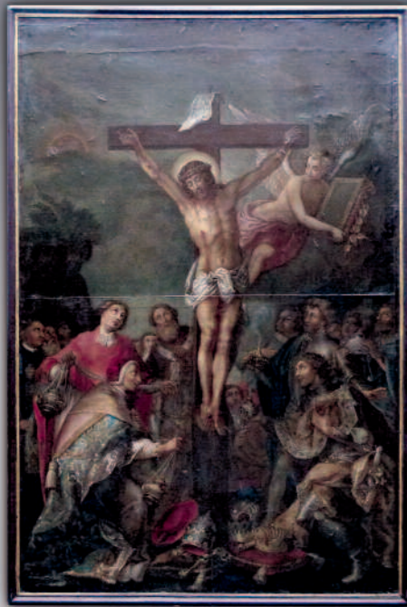
Süddeutsch, 17./18. Jhdt.