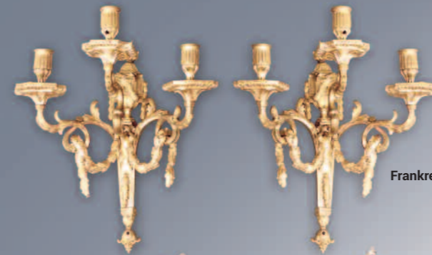
Frankreich, um 1800