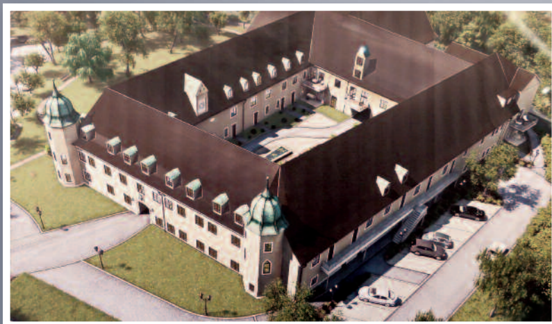
Schlossansicht nach Fertigstellung des Umbaus