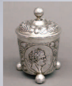
Augsburg um 1620, Meister Antonius Leser