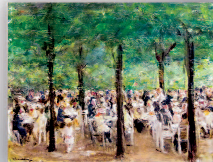
Max Liebermann, „Gartenlokal an der Havel“, mit Gutachten