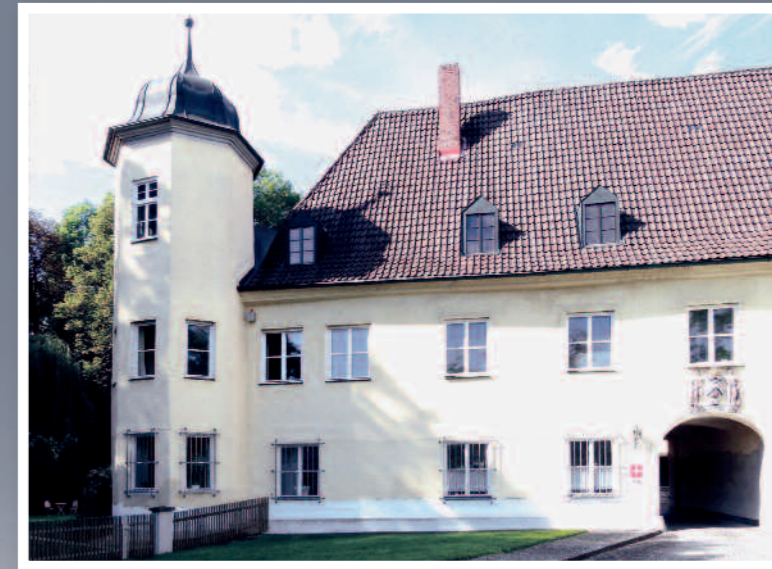
Vorderansicht der Schlossanlage Mering

Wir laden Sie ein zu einer sensationellen Auktion im November. Wir versteigern auch das Inventar des Schlosses Mering/Bayern. Die Auktion findet in unseren Räumen in Augsburg statt.