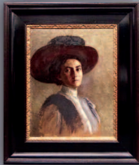
Frankreich, 18. Jh.