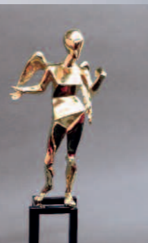
Kubischer Engel, Dali