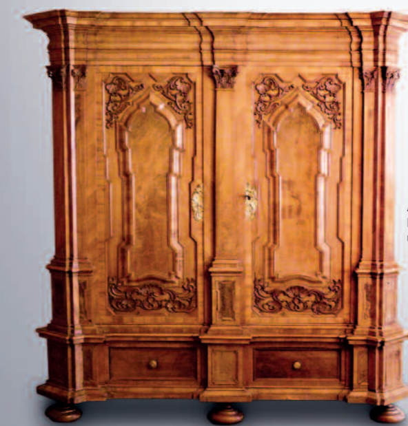
Augsburger Patrizierschrank um 1700