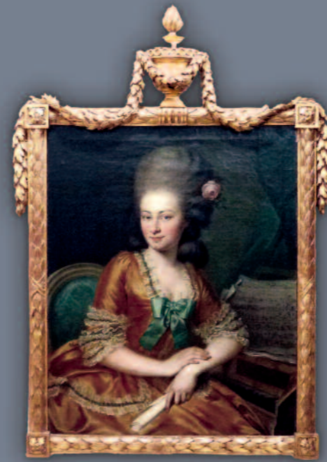
Frankreich, um 1780