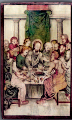
Paar Tafelbilder, 16. Jhdt.