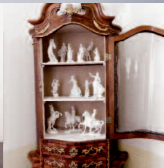
Sammlung Nymphenburg mit Barockvitrine