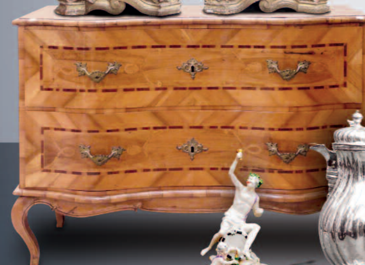
Barockkommode, Süddeutsch, 18. Jhdt.